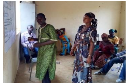
Formation de femmes

A Konna , 3 salles de classes ont été réceptionnées et accueillent des élèves de 4 e , 5 e et 6 e années. La nouvelle bibliothèque quant à elle, s'est vue doter de 600 livres.