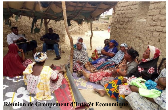
Réunion de Groupement d'Intérêt Economique