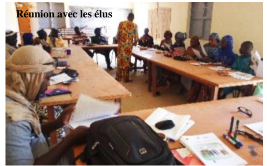
Réunion avec les élus

2 salles d'hospitalisation ont été aménagées et dix lits sont à disposition pour les malades.