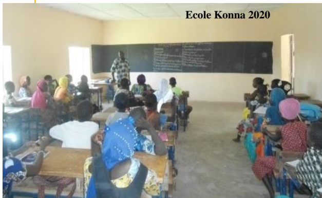
Ecole Konna 2020