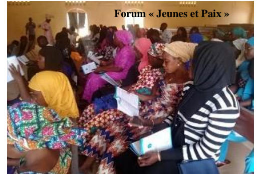
Forum « Jeunes et Paix »